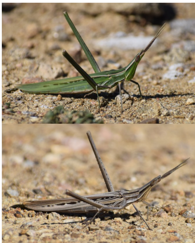
1. ábra. A sisakos sáska zöld és barna színváltozata a Nyugat-Mecsekben (Kővágószőlős, Kajdacs).

2019 augusztusában és szeptemberében botanikai valamint faunisztikai vizsgálatokat végeztünk a Villányi-hegység és a Mecsek területén. A sisakos sáska példányok észlése vizuális megfigyeléssel és fűhálós rovargyűjtéssel történt. Mivel egyértelműen azonosítható, de védett és lokálisan ritka fajról van szó, a példányok nem kerültek begyűjtésre, bizonyító erejű fényképek azonban készültek róluk (1. ábra).